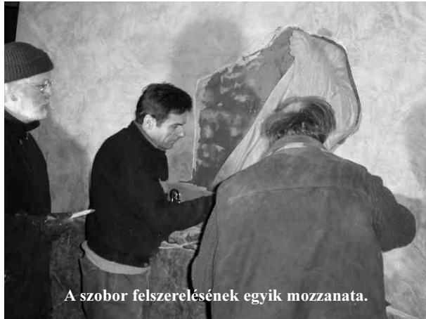
A szobor felszerelésének egyik mozzanata.

testület tagjainak, valamint a plébánia dolgozóinak segítségét, és természetesen, nem utolsósorban Érsek atyánk támogatását és jelenlétét.