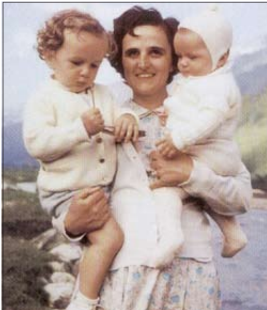
Szent Gianna Beretta Molla gyermekeivel

Érzem, hogy mindig a közelemben van, különösen a tanulmányi vizsgák időszakában, és segít nekem, ahogy életemben segített volna.