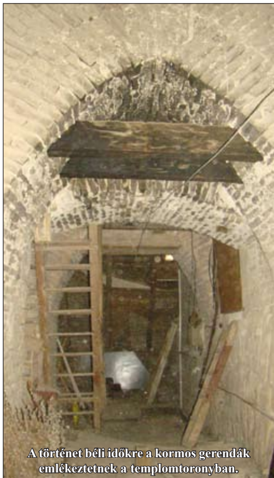
A történet béli időkre a kormos gerendák emlékeztetnek a templomtoronyban.

meg neki, másnap „elcsapta”, felmondott neki.