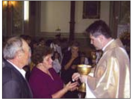
Édesapám és Édesanyám első szentmisémen a szentáldozás pillanatában

Szeretném megosztani a testvérekkel, hogy én milyen gondolatokkal és lelki indítással kezdtem meg papi életemet és hivatásomat.