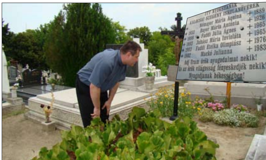
A Jánoshalmán elhunyt Kalocsai Szegény Iskolanővérek rendjébe tartozó 6 nővér közös sírban nyugszik a Kápolnás-temetőben, s nevük is olvasható a síremléken elhelyezett új emléktáblán