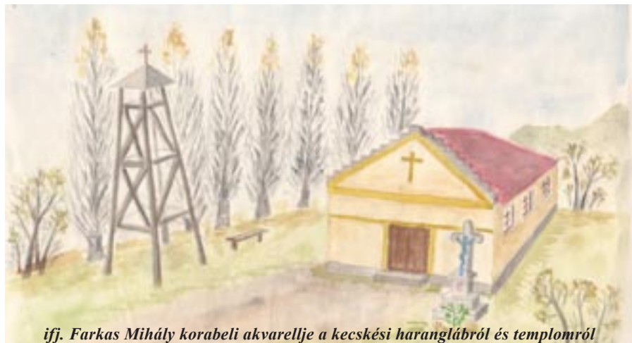
ifj. Farkas Mihály korabeli akvarellje a kecskési haranglábrol és templomról