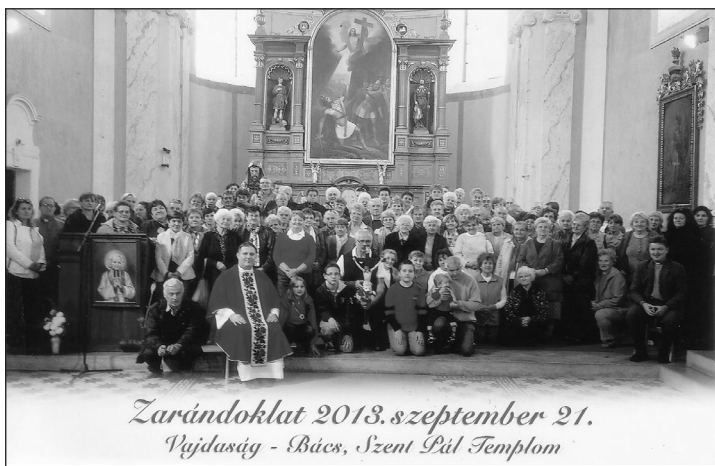
Zarándoklat 2013. szeptember 21. Pajdaság - Bács, Szent Pál Templom

A ferences templom megtekintése után mentünk a bácsi várba. Egykor valószínűleg