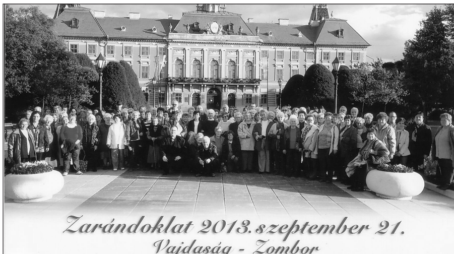
Zarándoklat 2013. szeptember 21. Vajdaság - Zombor

Ezután hosszú, viszontagságos időt élt át a város, és az itt élő nép.