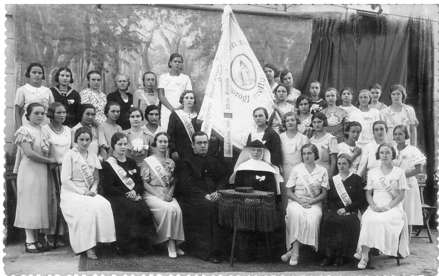
A Jánoshalmi Mária Kongregáció csoportképe 1941-ből