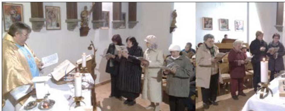
Egyházközségünkben a lelki örökbefogadás ünnepélyes ígérettétele március 25-én, Gyümölcsoltó Boldogasszony ünnepén a kápolnában bemutatott reggeli szentmise keretében volt.

Uram Jézus, Édesanyád, Mária közbenjárására, aki szeretettel szült világra Téged, valamint Szent Józsefnek, a bizalom emberének közbenjárására, aki születésed után gondoskodott Rólad – kérlek téged annak a meg nem született gyermeknek érdekében, akit lélekben adoptáltam, és akit a halál veszélye fenyeget. Kérlek, adj szüleinek szeretetet és bátorságot, hogy meghagyják gyermekük életét, melyet Te magad rendeltél számúra. Amen."