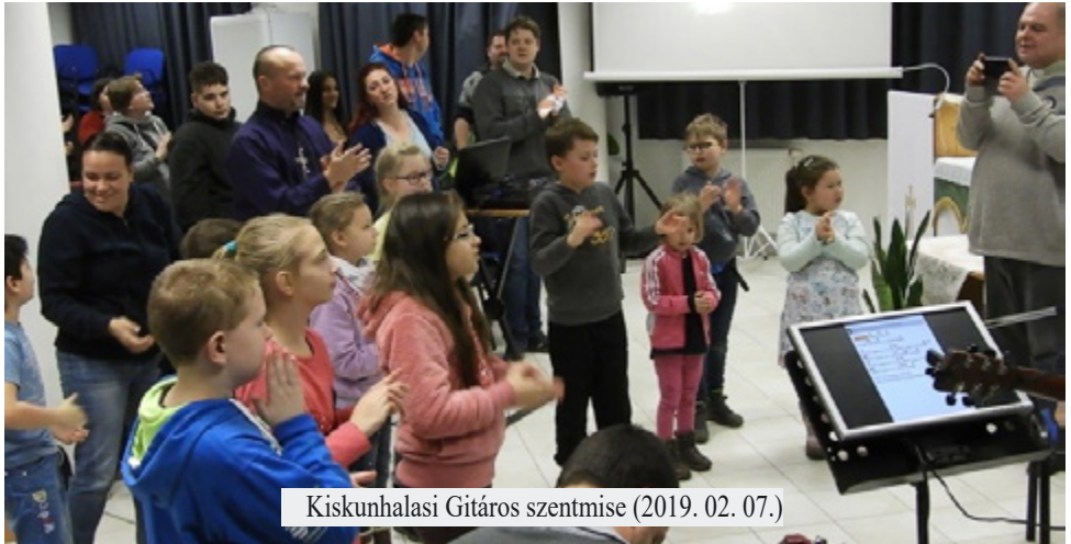
Kiskunhalasi Gítáros szentmise (2019. 02. 07.)