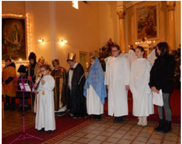
Karácsony - Pásztorjáték (2018. 12. 24.)