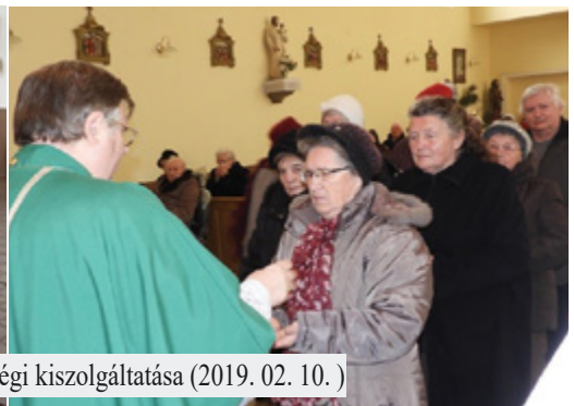
Betekkenetének közösségi kiszolgáltatása (2019. 02. 10.)