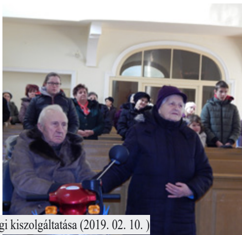
Betegek kenetének közösségi kiszolgáltatása (2019. 02. 10.)