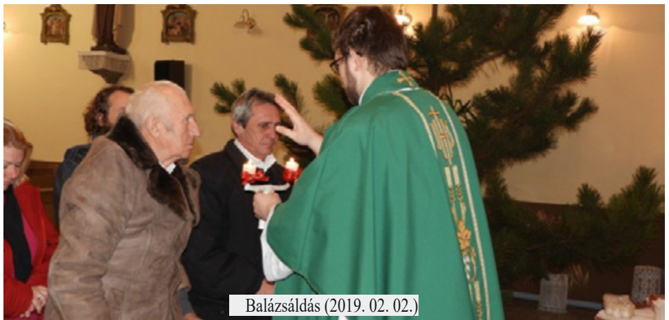
Balázsáldás (2019. 02. 02.)