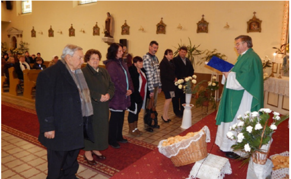
Jubiláns házások megáldása (2018. 11. 18. )