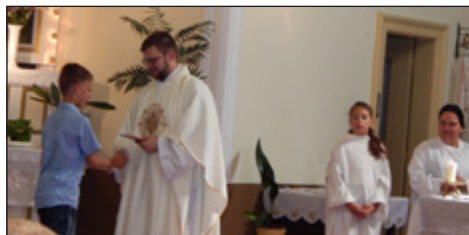
Te Deum – Tanévzáró szentmise (2019.06.16.)