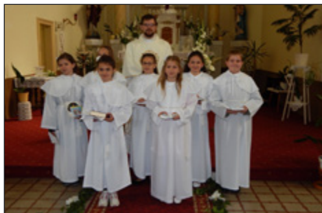
Elsőáldozás és elsőgyónó bemutatása (2019.05.19.)