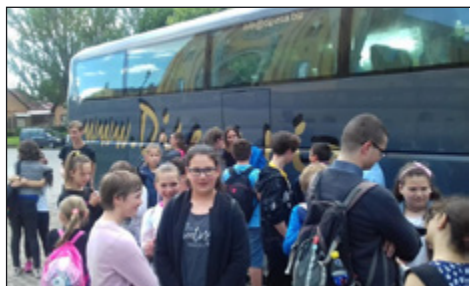
Hittanos zárandoklat, Fót – Vác 2019.05.25.