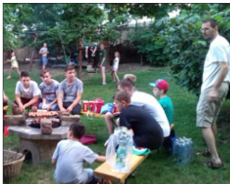
Ministráns tábor ; Szeged 2019.07.01-03.