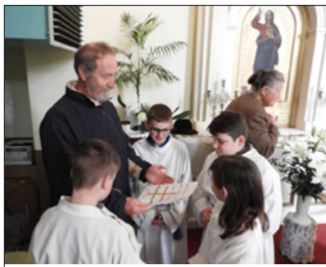
Kunféhértói hittanosok és ministránsok látogatása : (2019.04.07.)