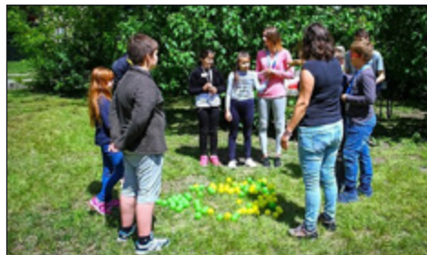
Ministráns találkozó : Baja (2019.05.11.)