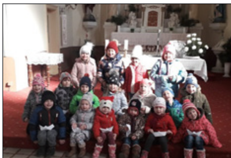
Óvodások a Plébánián és a templomban ; Ovis hittan