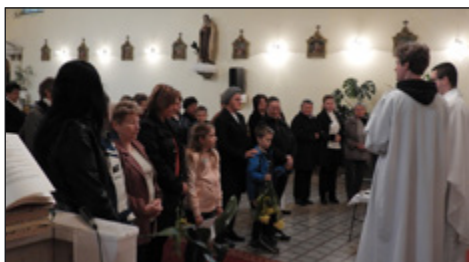
Édesanyák, nagymamák megáldása és búzaszentelés (2019.05.05.)