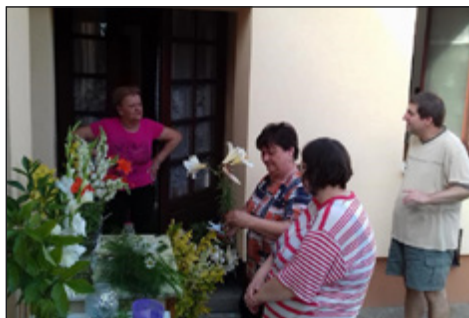
Úrnapj körmenet 2019.06.23.