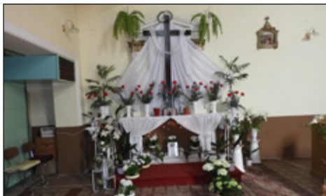
Húsvétvasárnap és ételszentelés (2019.04.21.)