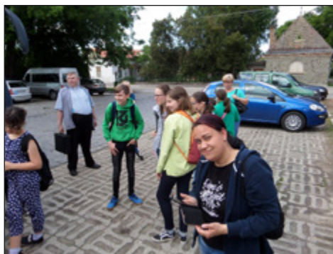
Hittanos zárandoklat : Fót – Vác (2019.05.25.)