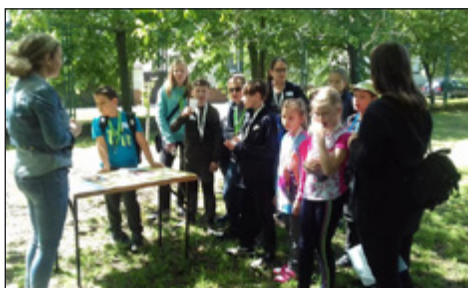
Ministráns zárandoklat , Baja 2019.05.11.