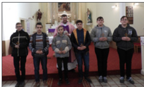
Keresztátadás 6.osztályosoknak (2019.03.31.)