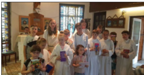
Te Deum : Tanévzáró szentmise 2019.06.16.