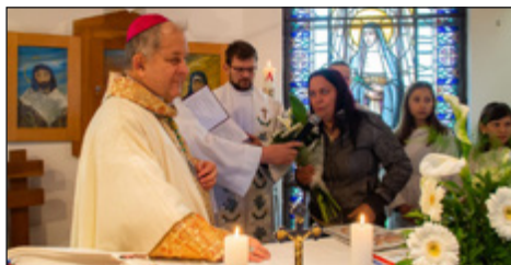
Templombúcsú és 30.évfordulónk