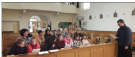
Elsőáldozási felkészítő és elsőgyónás (2019.05.15.)