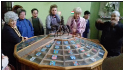
Ismerd meg egyházmegyédet zárandoklat 2019.05.04.