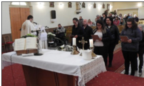
Hitvallás átadás 8.osztályosoknak (2019.04.28.)