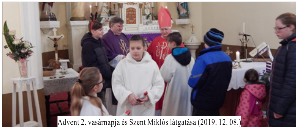
Advent 2. vasárnapja és Szent Miklós látogatása (2019. 12. 08.)