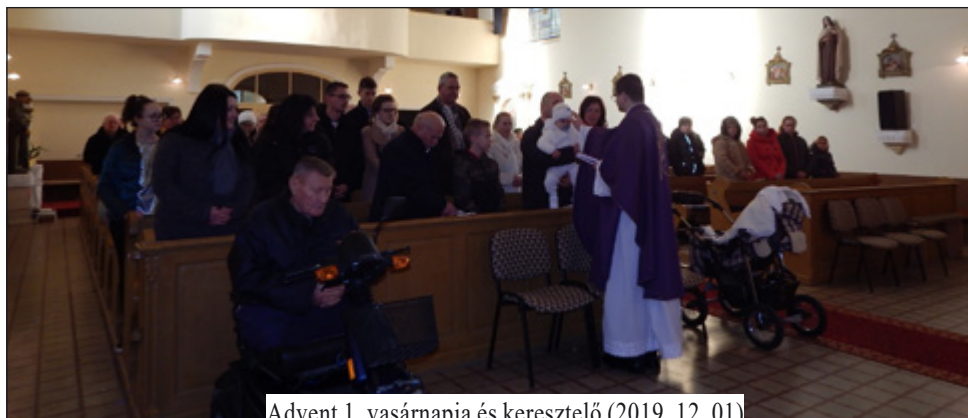
Advent 1. vasárnapja és keresztelő (2019. 12. 01)