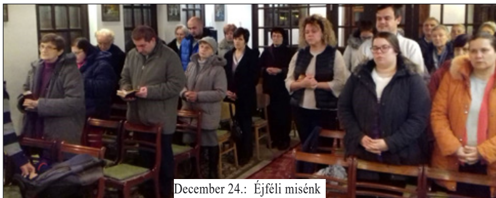
December 24.: Éjféli misénk