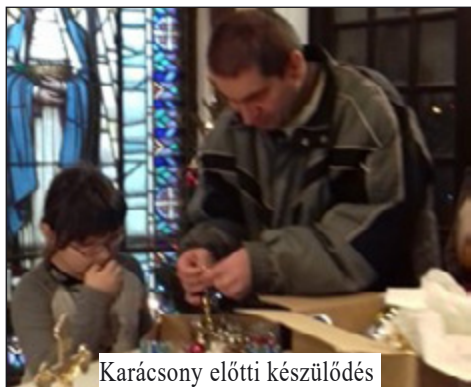
Karácsony előtti készülődés