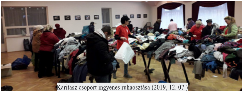
Karítasz csoport ingyenes ruhaosztása (2019, 12. 07.)