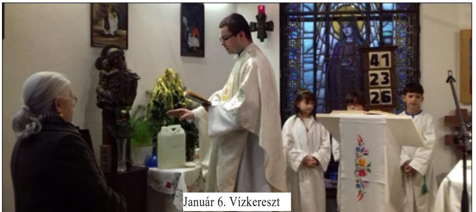
Január 6. Vízkereszt