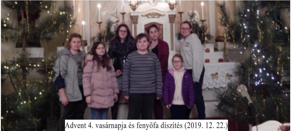
Advent 4. vasárnapja és fenyőfa díszítés (2019. 12. 22.)