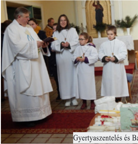
Gyertyaszentelés és Balázs-áldás (2019. 02. 02.)