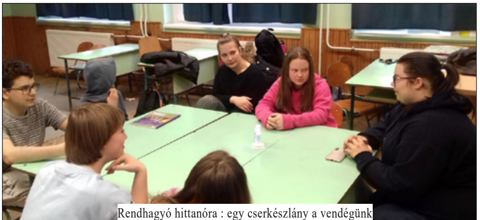
Rendhagyó hittanóra : egy cserkészlány a vendégünk