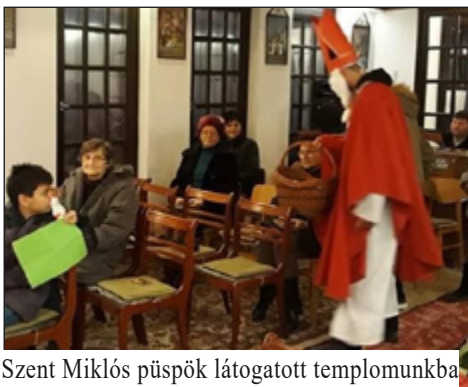
Szent Miklós püspök látogatott templomunkba