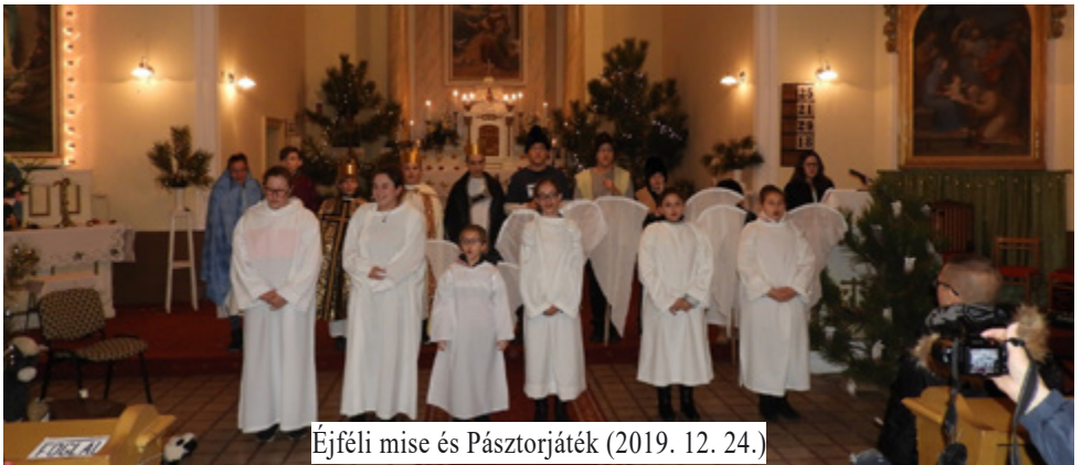
Éjféli mise és Pásztorjáték (2019. 12. 24.)