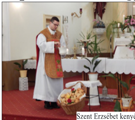
Szent Erzsébet kenyér megáldása (2019. 11. 24.)