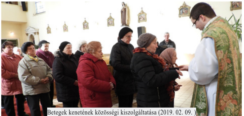
Betegek kenetének közösségi kiszolgáltatása (2019. 02. 09.)