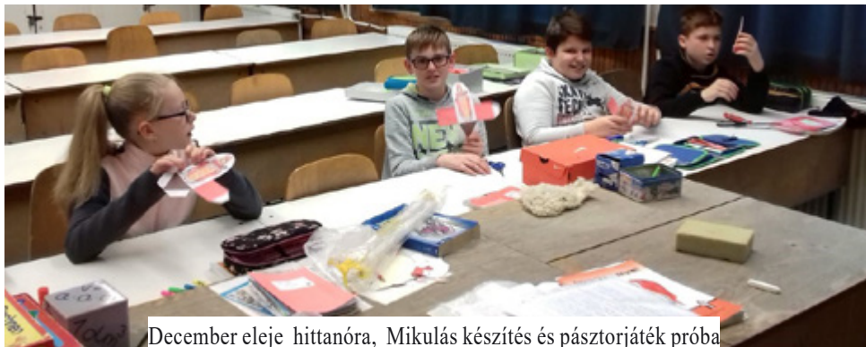
December eleje hittanóra, Mikulás készítés és pásztorjáték próba