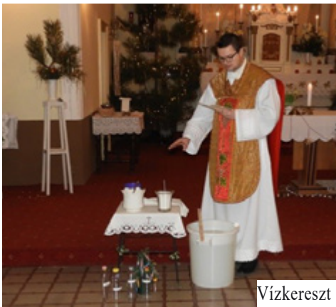
Vízkereszt (2020. 01. 05.)