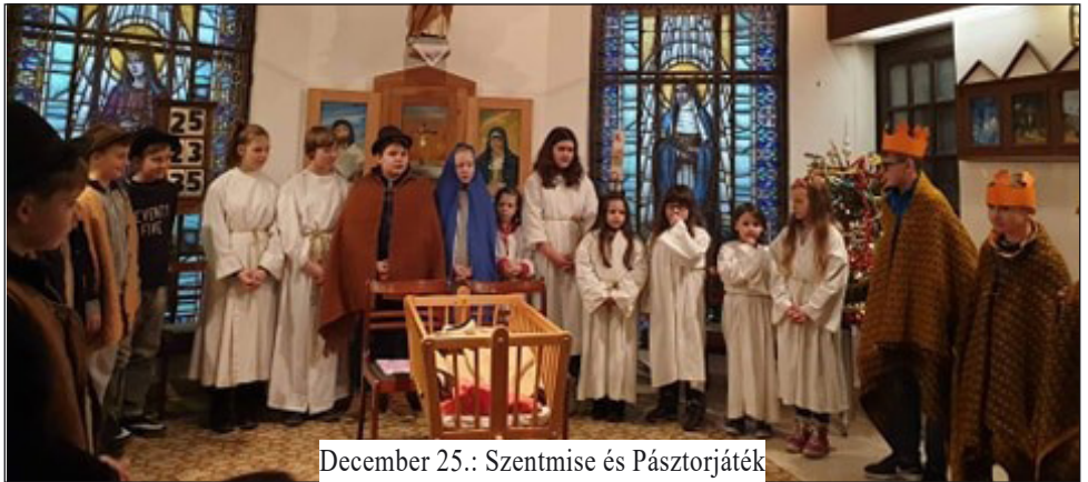
December 25.: Szentmise és Pásztorjáték