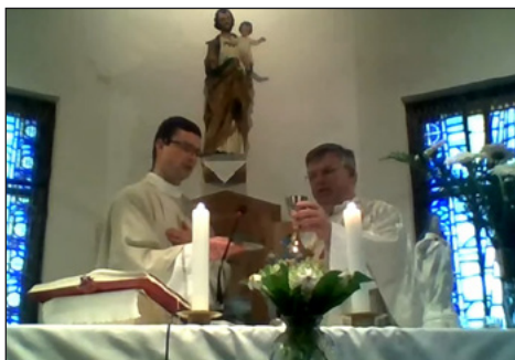
Búcsúi online szentmise