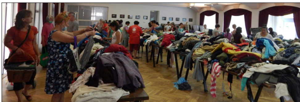
Borotai Karitás� ruhaosztás: 2020. 06. 27.